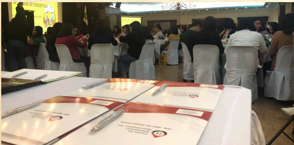
CEM Exhibit noong the 6th Provincial Assembly PGCA-Cavite Chapter