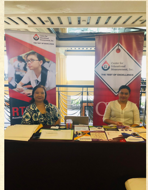
CEM Exhibit sa School of Tomorrow Philippine Educators' Convention 2019

Ang pagtitipon ay dinaluhan ng mga tagapamuno ng paaralan, mga guro, at mga magulang mula sa iba't ibang bahagi ng bansa na kasapi ng SOT. Ang dalawang araw na pagtitipon na ito na may paksang: Light your World , ay gaganapin din sa iba't ibang bahagi ng Pilipinas kabilang na ang mga siyudad ng Baguio, Davao, Cagayan de Oro, Iloilo, Cebu, at Maynila mula ika-19 ng Agosto hanggang ika-17 ng Setyembre 2019.