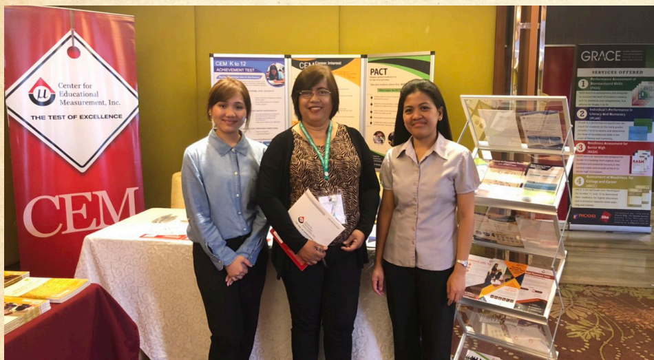
Ang Client Relations team kasama ang isa sa mga kalahok ng NCEME Conference